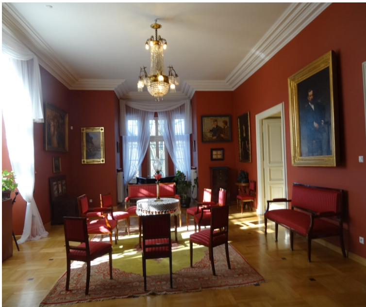
Pokój gościnny w dworku Sienkiewicza