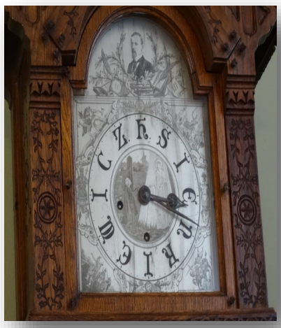
Ekspонат w dworku Sienkiewicza